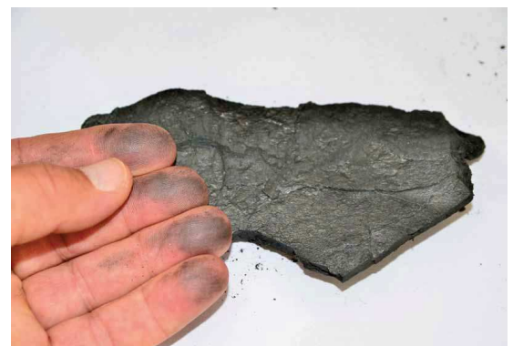
Graphit färbt schwarz ab La grafite tende a tingere di nero From graphite you get blackened fingers

Acritarchs (Algae) of the Early Paleozoic Era (A-F). Normally, fossils are not found in quartz phyllite since any remains that might be present are destroyed during metamorphosis. But every rule has an exception: In the only slightly metamorphic quartz phyllite series of the Col di Foglia near Agordo/Belluno, researchers in 1985 succeeded in demonstrating the presence of so-called acritarchs. Acritarchs are round or oval bodies approx. 0.01 to 0.05 millimeters in size which may represent the spores or cysts of different kinds of algae.